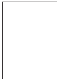
മേരിലീൻ കെ. ബിജു മുഖവന ക്ലാസ് - 11, III rd (മാർക്ക് - 40)