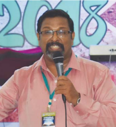
മോട്ടിവേഷൻ : സുനിൽ ഡി. കുറുവിള