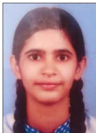
ഫേബാ സാം വയല ക്ലാസ് - 11, II nd (മാർക്ക് - 41)