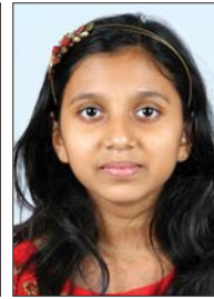
ജെസ്സാ സാബു ചക്കുവരയ്ക്കൽ ക്ലാസ് - 5, II nd (മാർക്ക് - 40)