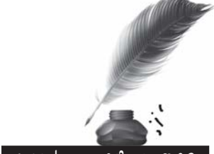
ജനറൽ സെക്രട്ടറി എഴുതുന്നു...